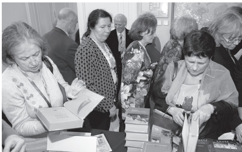
Знакомство с изданиями Международного Центра Рерихов