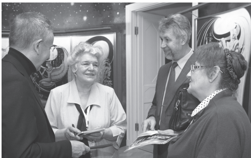
Дружеские встречи в кулуарах