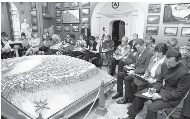
Участники конференции в одном из залов Музея имени Н.К.Рериха